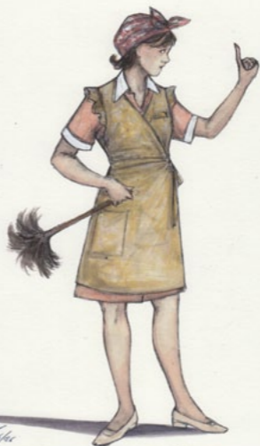
1944/45 La modista a Parigi - Quicky -