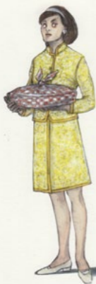
1944/45 La modista a Parigi - MEG PAGE -