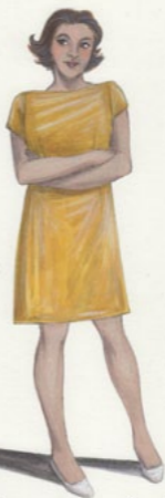
1944/45 La modista a Parigi - ALICE FORD -